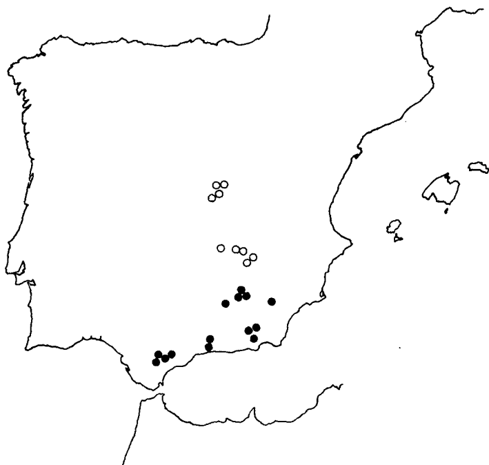
Mapa 1.—Localidades estudiadas de: ● S. boissieri y ○ S. almolae .

dicaciones que coinciden exactamente con las figuras del ícón 26 de BOISSIER. Esta descripción no sería publicada, ya que al recibir el material cultivado en 1850 de S. boissieri , ve que no existen diferencias entre ésta y S. germana , que él había publicado en un trabajo de COSSON (1849) y así lo indica en otra de las notas manuscritas por él en 1851 y que se encuentra en dicho pliego. Por todo lo anteriormente expuesto, se deduce que el único elemento que disponía GAY al hacer válida la publicación de S. boissieri , es el ícón de BOISSIER por lo que dicho ícón debe constituir el tipo de Silene boissieri .