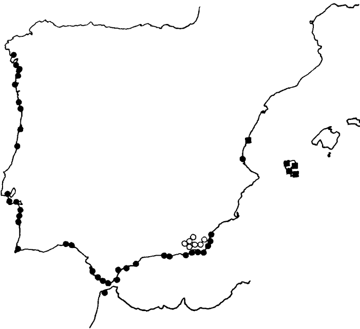
Mapa 2.—Localidades estudiadas de: ● S. littorea subsp. littorea , ○ S. littorea subsp. adscendens y ■ S. cambessedesii .

mínguez & Talavera (SEV 29517); ídem, 7.III.1977, Soler (SEV 29513). Cádiz. Algeras , 14.V.1873, Fritze (COI, herb. Killk.); ídem, 15.IV.1876, Winkler (COI, herb. Willk.); ídem, VII.1897, Huter (Z, ZT). Barbate de Franco , 6.IV.1974, Silvestre & Talavera (SEV 12140). Cabo de Trafalgar , 6.IV.1974, Silvestre & Talavera (SEV 21241). Chiclana de la Frontera , playa de la Barrosa , 5.IV.1974, Silvestre & Talavera (SEV 21239). Gibraltar , 2.IV.1845, Willkomm (COI, herb. Willk.); ídem, Bahía Catalana , 25.III.1969, Heywood, Moore & al. (SEV 21242). Tarifa , Punta Palomas , 23.IV.1976, Ladero (MAF 94927). Entre Vejer de la Frontera y Cabo de Trafalgar , 20.III.1975, Galiano & al. (SEV 21243). Granada. Playa de Calahonda , 10.VI.1974, Dominguez & Talavera (SEV 29512). Motril , sin fecha, Clemente (MA 32252). Huelva. Huelva , 5.V.1931, Gros (MA 30852 & 30851). Punta Umbría , 5.III.1971, Galiano & Cabezudo (SEV 8875). La Coruña. Noya , playa del Testal , 22.IV.1966, Bellot & Casaseca (SEV 718); ídem, 29.III.1948, Bellot & Casaseca (MA 188494); ídem, 27.II.1949, Bellot (MA 30849); ídem, 14.IV.1953, Bellot & Casaseca (MAF 2584). Santa Eugenia de Ribeira , 7.IV.1957, Bellot & Casaseca (MA 188495). Tordoya ; Baldayo , 16.III.1968, Lainz (SEV 9641). Málaga. Estepona , 14.IV.1845, Willkomm (COI, herb. Willk.). Ma-